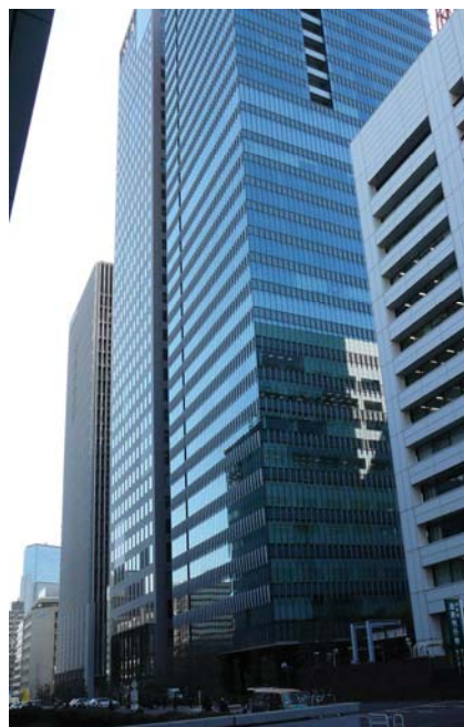
2009年3月に竣工した日経本社ビル

新社屋の環境対策で、効果の顕著なものは関連会社や他の事業所にも取り入れていく計画であり、新社屋は日経グループの省エネ活動の司令塔としての役割を担っている。新社屋の快適な環境の中で働く社員一人ひとりの関心を一段と高め、環境問題に深い自覚と責任を持って課題に対処できる人材の育成に全力投球していく。