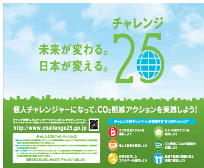
チャレンジ25キャンペーンポスター

「チーム・マイナス6%」運動の総括を行い、次の「チャレンジ25」への足がかりにしたい。