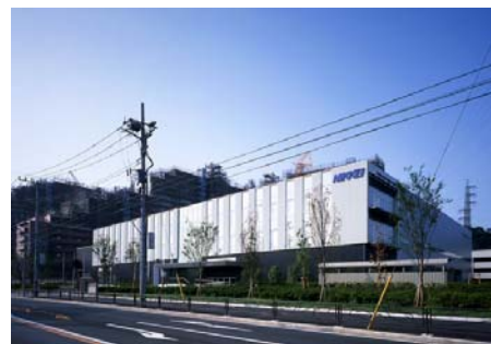
オール電化を実現して表彰を受けた川崎工場 (2006 年 9 月に稼働)

印刷工場の建設に際して、先進の省エネ技術を導入することにより温室効果ガスの発生を極力抑制してきた。2006 年に稼働した川崎工場では、氷蓄熱システムを採用、これにより設備を効率的に運用することでオール電化工場を実現、この点がヒートポンプ・蓄熱センターから評価され表彰を受けた。工場なども含めグループ全体で地球温暖化防止に連携して力を注いでいく。