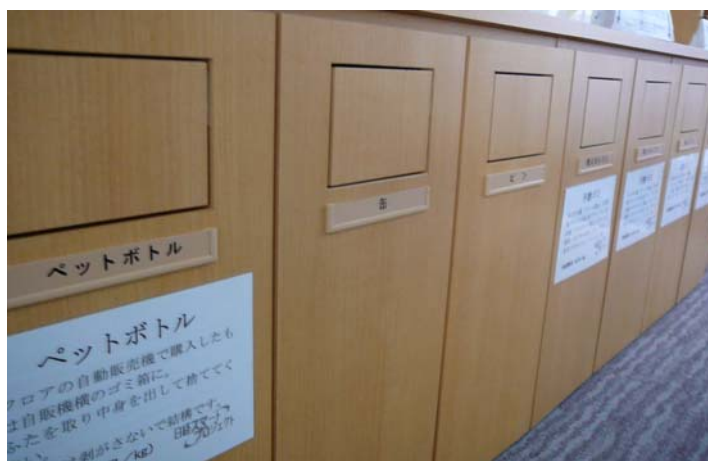
東京本社ビルのゴミ分別ステーション、最終的に12種に分別